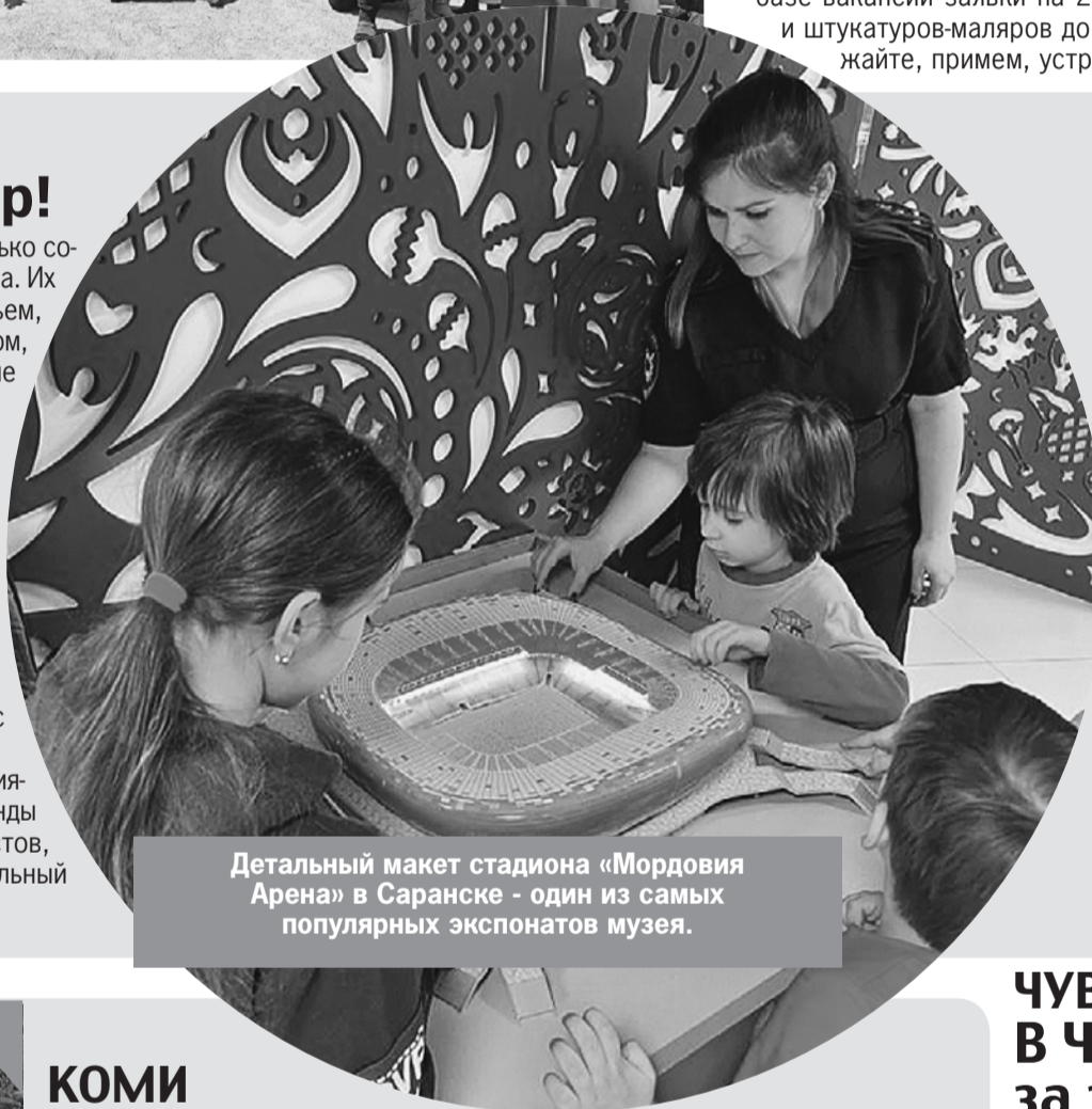
Детальный макет стадиона «Мордовия Арена» в Саранске - один из самых популярных экспонатов музея.

- А еще, - делятся ребята впечатлениями, - музей спорта - здесь есть стенды с футболками известных футболистов, исписанными автографами, и детальный макет самого стадиона.