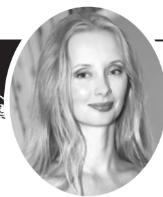
Экспресс - газета Москва