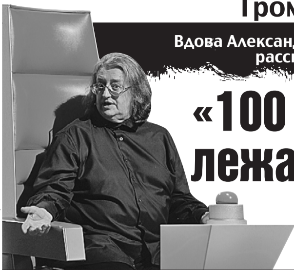
Александр Градский скончался 28 ноября прошлого года на 73-м году жизни.