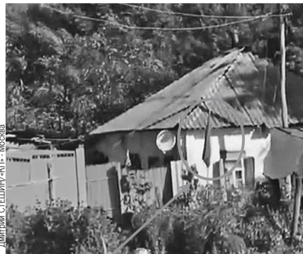
Красное знамя над уже хорошо знакомым домом стало для летчиков доброй приметой.

- Собрали для нее продовольственный паек. Как возвращались с задачи, хотели ей передать, но ее не оказалось дома. Тогда приняли решение оставить посылку с письмом во дворе дома.