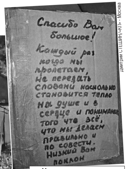
Когда вертолетчики прилетали в первый раз, бабушки дома не оказалось. Они оставили ей посылку и небольшое послание.

«сошествие летчиков с небес» к той, кто за них молится и благословляет на ратные подвиги, совпало с полугодовым «юбилеем» специальной военной операции. Никто не подгадывал специально к дате, просто так получилось. И если разобраться, в этой истории очень много смыслов.