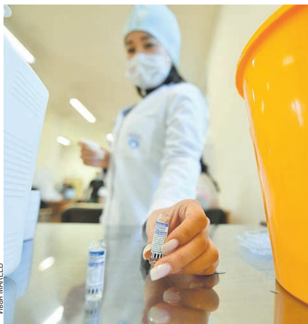
Прививки доступны и детям от 12 лет.