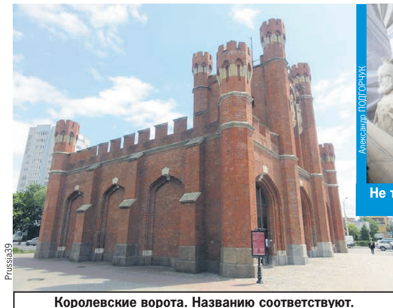
Королевские ворота. Названию соответствуют.

Возможно, самое ценное, что осталось в Калининграде от Кёнигсберга, - это городские ворота. Во всяком случае, одно из самых ценных. Потому что ворота дошли до нас почти что все, за исключением тех, которые были снесены еще до войны. Например, за исключением Штайндаммских ворот, которые, между прочим, считались самыми красивыми. Однако в 1912 году пали в неравной борьбе с германским прагматизмом. Однако и тех ворот, что остались, - а их насчитывается семь штук - хватает, чтобы организовать отдельную экскурсию.