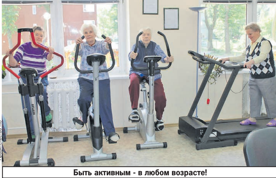
Быть активным - в любом возрасте!

Людам почтенного возраста предоставляются различные виды соцслуг. Для этого в регионе работают дома социального ухода, реабилитационный центр, госпиталь для ветеранов войн, муниципальные центры и социально ориентированные некоммерческие организации. Нуждающимся в постороннем уходе предоставляются соцслуги на дому и в стационарной форме. В 2022 году свыше 4700 жителей области воспользовались помощью соцработ-