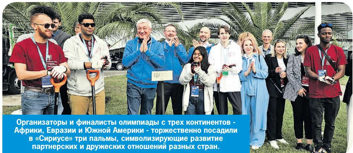
Организаторы и финалисты олимпиады с трех континентов - Африки, Евразии и Южной Америки - торжественно посадили в «Сириусе» три пальмы, символизирующие развитие партнерских и дружеских отношений разных стран.

Я уверена, что финалисты этой олимпиады будут приезжать в «Сириус» уже как руководители стартапов или крупных проектов, а также в качестве педагогов или экспертов. Включение школьников в обсуждение сложных вопросов - защиты банковской сферы, финансовой грамотности и других - это уже важный профессиональный шаг в подготовке специалистов.