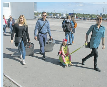
Гостям в Калининградской области рады!