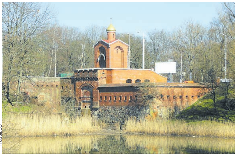
Аусфальские ворота удивляют...

Самыми красивыми и, если хотите, главными считаются Королевские ворота, через которые некогда проходила дорога из Кёнигсберга в Лабиау, нынешний Полесск. Эти ворота похожи на небольшой замок с башенками. Украшением здания являются три барельефа на внутренней, обращенной к городу стороне ворот, на которых изображены значимые для истории Кёнигсберга персо-