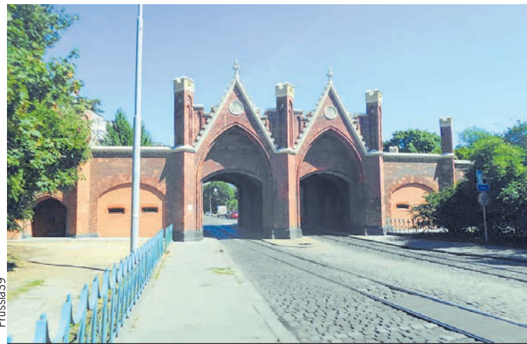
...а Бранденбургские - служат водителям и пешеходам.