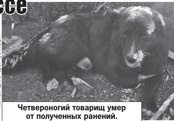
Четвероногий товарищ умер от полученных ранений.