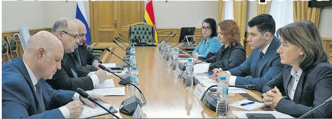
Главными темами для обсуждения стали вопросы жизнеобеспечения нашей области.

Главными темами для обсуждения стали вопросы жизнеобеспечения нашей области: региональный транзит, логистика и перемещение грузов, приграничное сотрудничество многое другое. - Проведенная МИДом России летом этого года работа по линии взаимодействия с Еврокомиссией и Литвой дала значимые результаты в виде сохранения части автомобильного и железнодорожного «калининградского транзита». Тем не менее хотели бы сегодня обсудить