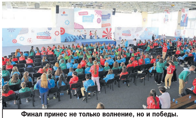
Финал принес не только волнение, но и победы.

- Наши школьники - активные участники всероссийских проектов. Они всегда достойно представляют Калининградскую область, постоянно делятся своими идеями и предложениями, в том