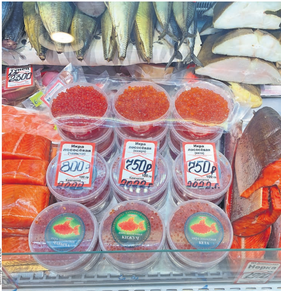
Приближается Новый год, икра начала расти в цене.

КОТИКИ ищут любящих, заботливых хозяев. Тел.: 8-952-794-30-29, 8-929-167-60-77.