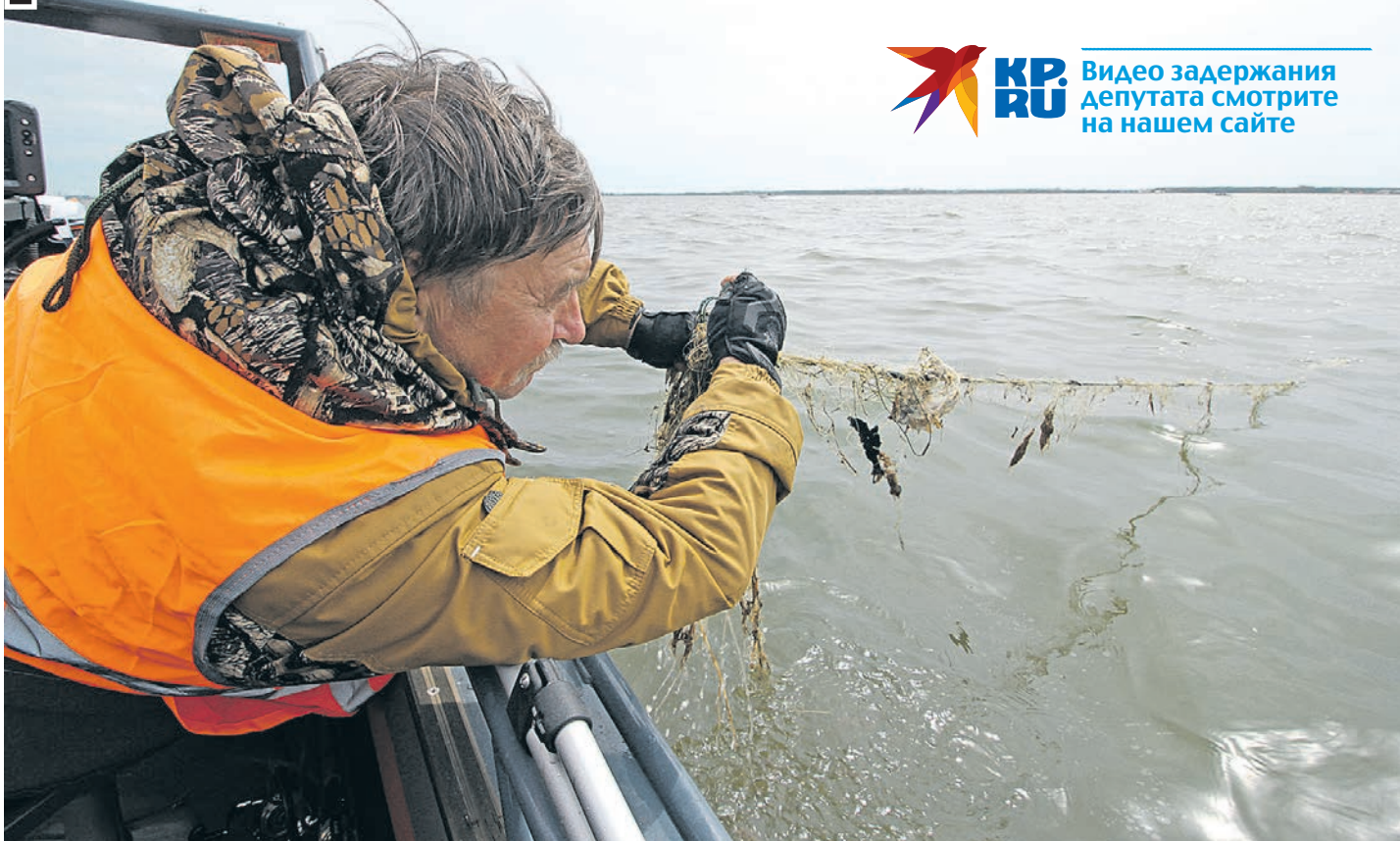
В сетях оказалось порядка 450 килограммов рыбы.