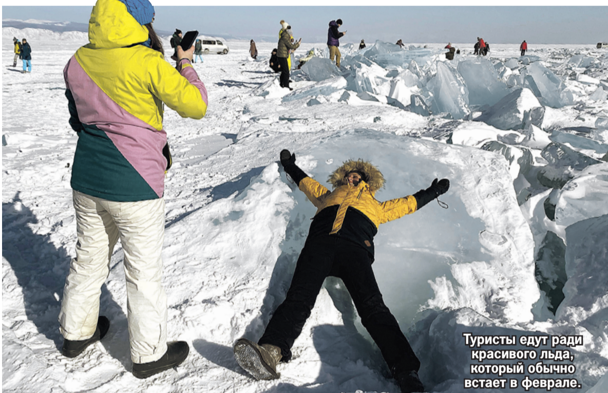
Туристы едут ради красивого льда, который обычно встает в феврале.