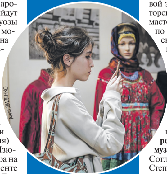
Посетители не заскучают!

Впервые «Ночь искусств» прошла в Иркутске 3 ноября 2013 года. Тогда участие в акции приняли три областных музея.