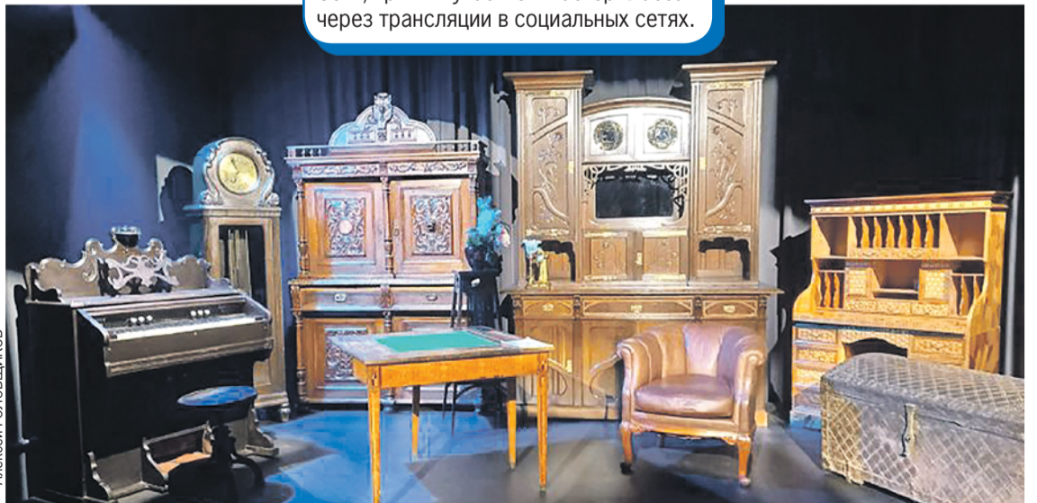
Выставка мебели: разглядывать раритеты можно часами.

В 2020 и 2021 году «Ночь искусств» проходила онлайн. Иркутянам предлагали посмотреть видеозаписи спектаклей, побывать на экскурсиях с помощью Сети, принять участие в мастер-классах через трансляции в социальных сетях.