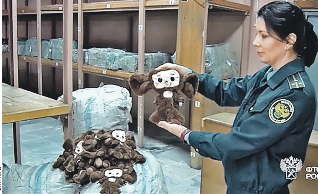
На волне популярности фильма «Чебурашка» Россию наводнили ушастики-нелегалы. Например, в прошлом году таможенники изъяли у китайца 1179 контрабандных «игрушек безымянных», которых он вез на продажу в Россию в семи мешках.

фабрики. Не каждый профи отличит их товар от фирменного. Ткань приятная, все бирки есть, QR-код. Только если навести камеру на настоящую заровскую бирку, увидишь страничку конкретного товара, а QR реплика выводит просто на сайт Zara. Но на такие товары жалоб нет.