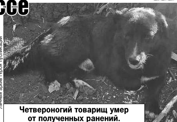
Четвероногий товарищ умер от полученных ранений.