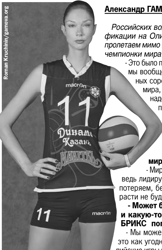
Катя Гамова советует не паниковать раньше времени.