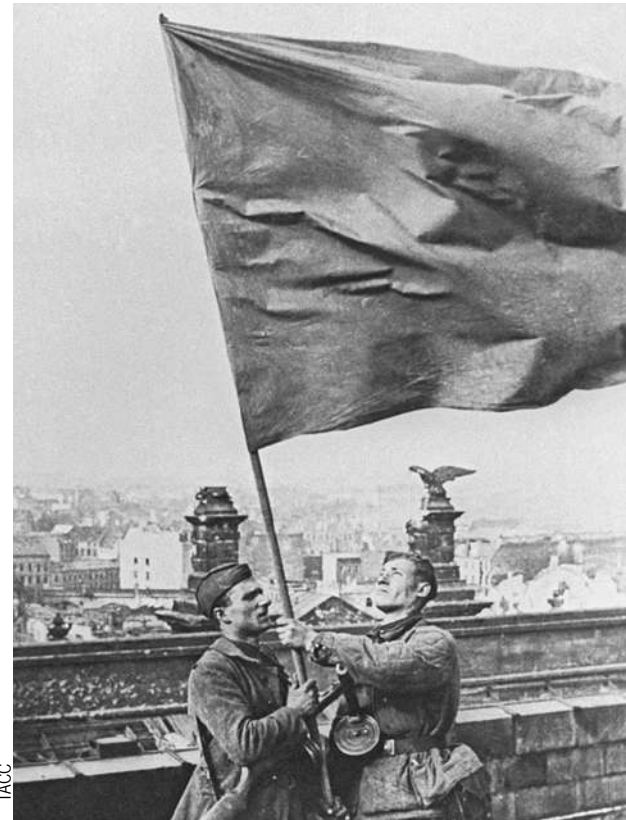
1 мая 1945-го наши бойцы водрузили на Рейхстаг Знамя Победы. Ночью немцы его сбросили, и 2 мая Мелитону Кантарии (слева) и Михаилу Егорову пришлось снова подняться на крышу.

Конечно же, Георгию есть что терять. Близкие, друзья, любимый марафонский бег, съемки в кино, которые он для себя открыл недавно, став участником массовки в фильме «Фронтная разведка. Позывной «Журавли» Игоря Угольникова. Кстати, Угольников, узнав, что у него «в куче» бегают сам Кантария, пообещал парню более заметную роль. Но это уже по возвращении.