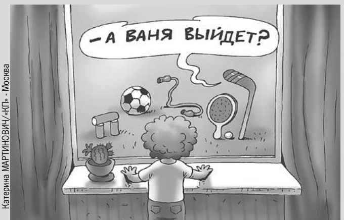
Катерина МАТИНОВИЧУ-КП - Москва

Как сообщают информагентства, в российских школах на уроках физкультуры могут начать обучать детвору лапте и даже городкам (подробности > стр. 8).