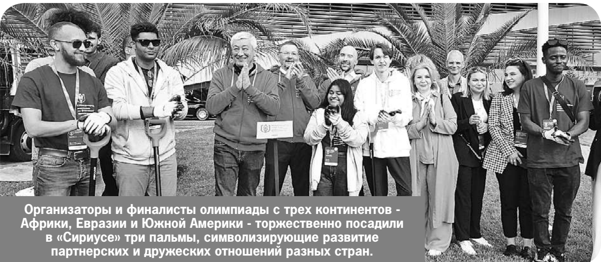
Организаторы и финалисты олимпиады с трех континентов - Африки, Евразии и Южной Америки - торжественно посадили в «Сириусе» три пальмы, символизирующие развитие партнерских и дружеских отношений разных стран.

Я уверена, что финалисты этой олимпиады будут приезжать в «Сириус» уже как руководители стартапов или крупных проектов, а также в качестве педагогов или экспертов. Включение школьников в обсуждение сложных вопросов - защиты банковской сферы, финансовой грамотности и других - это уже важный профессиональный шаг в подготовке специалистов.