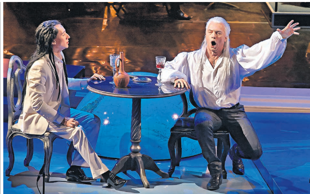
«Демон» Рубинштейна в зале Чайковского, 2015 год