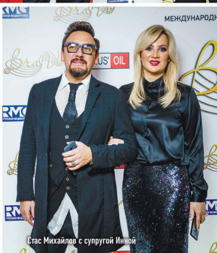
Стас Михайлов с супругой Инной