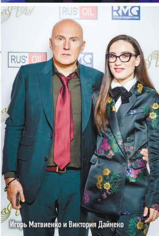
Игорь Матвиенко и Виктория Дайнеко