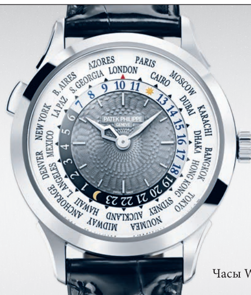
Часы World Time мод. 5230G

Москва: Столешников пер., 15, бутик Patek Philippe ЦУМ; Третьяковский проезд, 7; Кутузовский пр-т, 31 Барвиха Luxury Village; С.-Петербург: ДЛТ