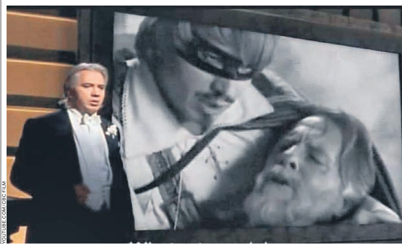
Кадр из фильма «Дон Жуан без маски», 2000 год

был период, когда он уверенно заявлял о себе как моцартовский баритон. И в этом смысле трудно представить себе более подходящего для него персонажа, чем Дон Жуан. С этой партией он выступил на Зальцбургском фестивале в 1999-м, на исходе интендантства Жерара Мортье. Впрочем, героичность моцартовского соблазнителя в спектакле знаменитого итальянского режиссера Луки Ронкони оказывалась под сомнением: на протяжении оперы Дон Жуан все старел и ста-