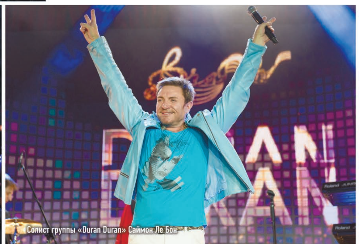
Солист группы «Duran Duran» Саймон Ле Бон