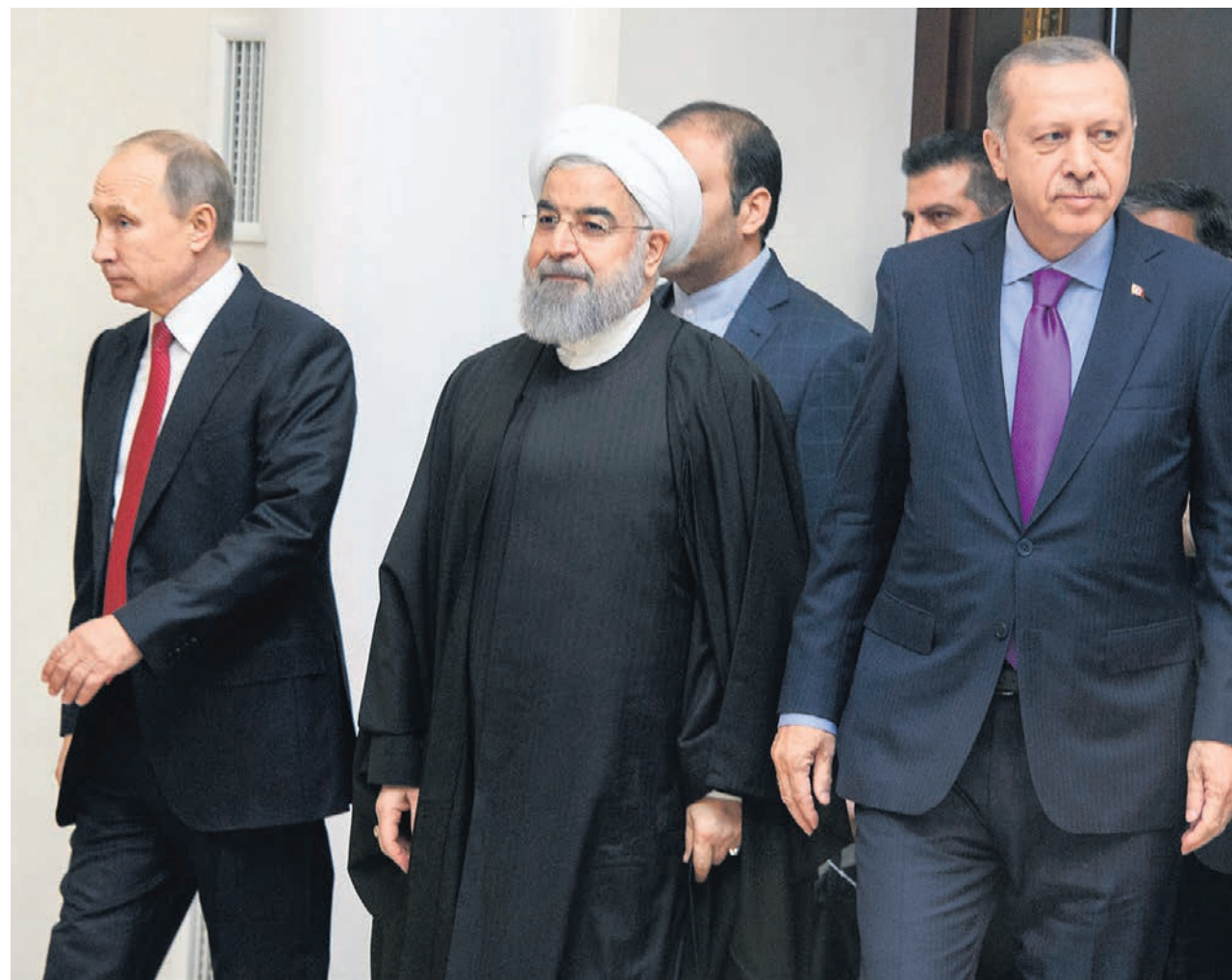
После переговоров выяснилось, что президенты России, Ирана и Турции не только глядят, но и думают в разные стороны

Что-то мне все это очень уж напоминало. — Благодаря усилиям России, Турции и Ирана, —