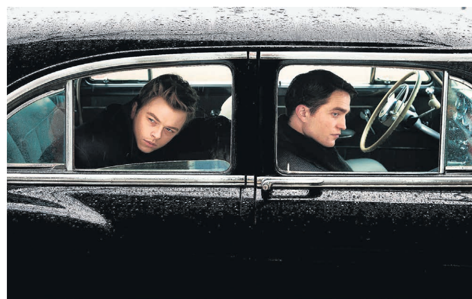
Фильм превратился в элегантную анимированную фотосъемку, иллюстрирующую одержимость Денниса Стока (Роберт Паттинсон) своим героем Джеймсом Дином (Дейн Де Хаан)

Корбейн оживляет кадры из репортажа Денниса Стока для журнала Life, где Дин спит лицом на столе после попойки или читает книжку с племянником, и весь фильм превращается в элегантную анимированную фотосъемку. Сток становится альтер эго Корбейна, и в этом главная ловушка. Режиссер Корбейн влюблен в историю, как фотограф, и концентрируется на деталях, которые на самом деле не так уж и важны. «Жизнь» идет своим чередом без ярких всплесков, это ровная драма, в которой главные увлечения Дина после кино, гонки и спортивные автомобили, к сожалению, остаются за кадром. А ведь актер обладал не только трудным и увлекательным ха-