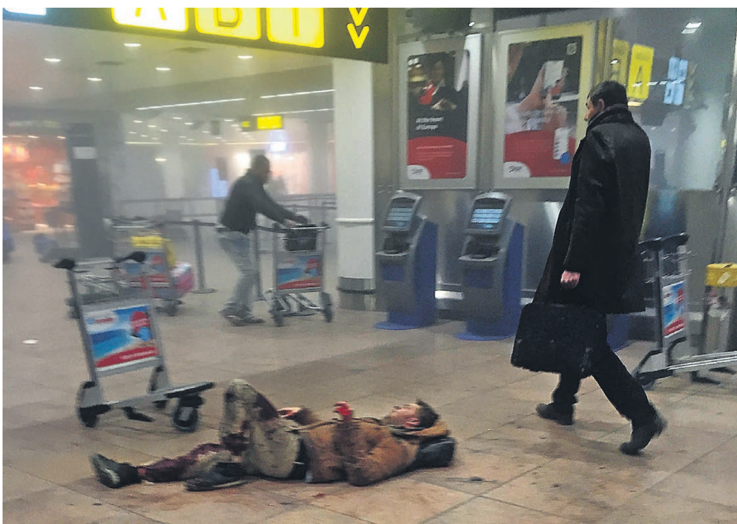
Первый удар террористы нанесли по брюссельскому аэропорту

Несколько раз приходили сообщения о новых взрывах, но все они оказывались делом рук бельгийских саперов, ликвидировавших подозрительные предметы по всему городу. В середине дня Бельгия и Франция перекрыли границу для движения грузовиков и пассажирских поездов. «Как только стало известно о терактах в Брюсселе, я принял решение направить на границу дополнительно 1,6 тыс. жандармов и полицейских», — сообщил глава МВД Франции Бернар Казнёв после экстренного совещания в Елисейском дворце с президентом Франсуа Олландом и премьером Манюэлем Вальсом.