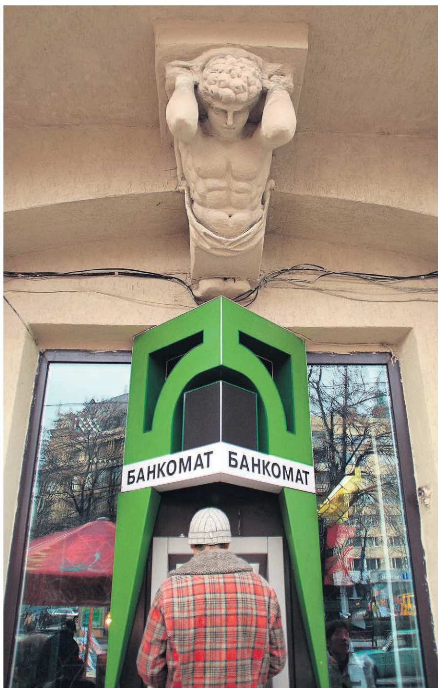
Чтобы оценить ситуацию в вашем банке, теперь можно просто узнать, в какой налоговой он обслуживается.

Такая избирательность ФНС в переводе банков в 9-ю инспекцию, вероятно, связана с расчисткой банковского рынка, проводимой ЦБ с 2013 года. — на текущий момент регулятор отозвал лицензии у 291 банка, из которых 205 признаны банкротами. Судя по всему, налоговики просто не хотят заниматься напрасной работой, отмечают участники рынка. Перевод из одной инспекции в другую требует проведения определенных затрат (сверка налоговых платежей, передача карточки компа-