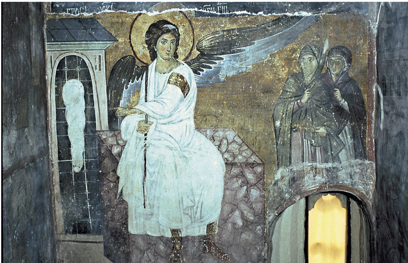
Белый Ангел и Женщины-мироносицы. Фрагмент фрески Вознесения в монастыре Милешево, Сербия. До 1228 г.

Еще одно свидетельство подлинности — «неудобные» детали повествования, которые редактор обязательно бы удалил. Так, первыми Воскресшего Христа встречают женщины. Современного читателя это не особенно поражает, но в древнем мире это было крайне неприятной подробностью — женщины не считались надежными свидетелями, даже в суде их показания не принимались всерьез. ❀