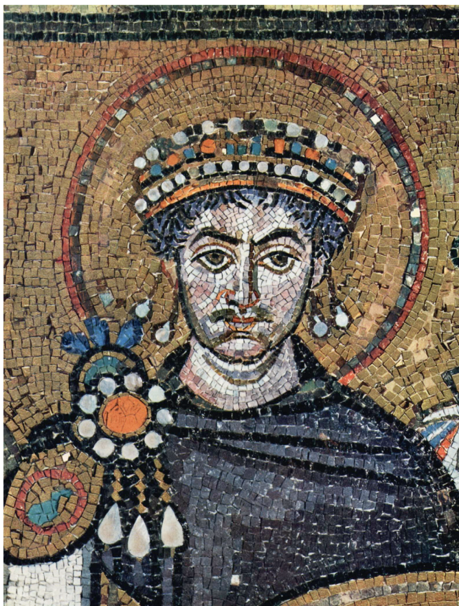
Юстиниан I Великий. Сан-Витале. Равенна, сер. VI века

не было известно. В 545 году Юстиниан Великий, под властью которого находилась тогда Едесса, воевал с царем персидским, Хозроем I. Едесса постоянно переходила из рук в руки — от греков к персам и обратно.