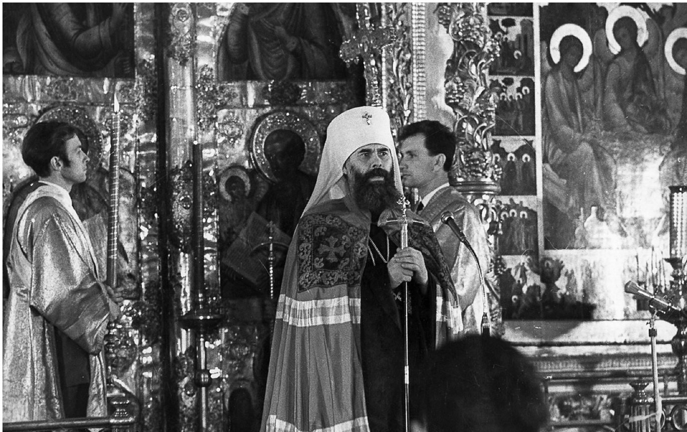
Митрополит Сурожский Антоний (Блум) (1962–2003) Пасха, 6 апреля 1980 г.