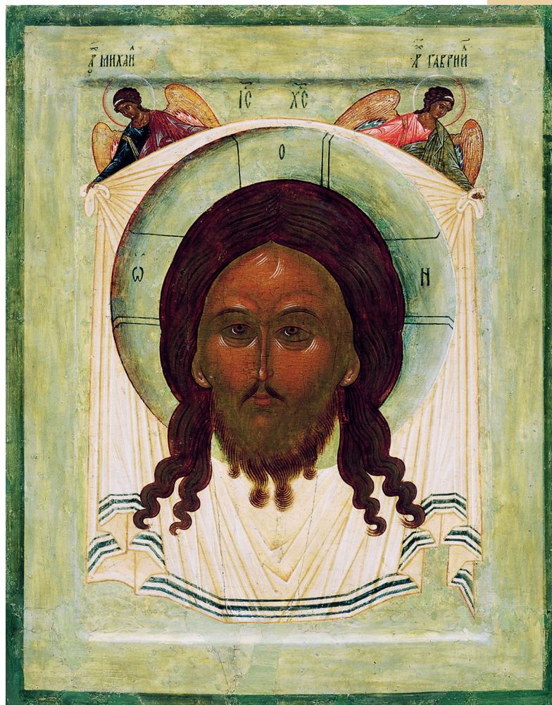
Спас Нерукотворенный с архангелами Михаилом и Гавриилом. Вторая половина XVI в.

✚ Он либо просто вписан в нимб, либо изображается на убрусе, а иногда убрус держат Ангелы. ✚