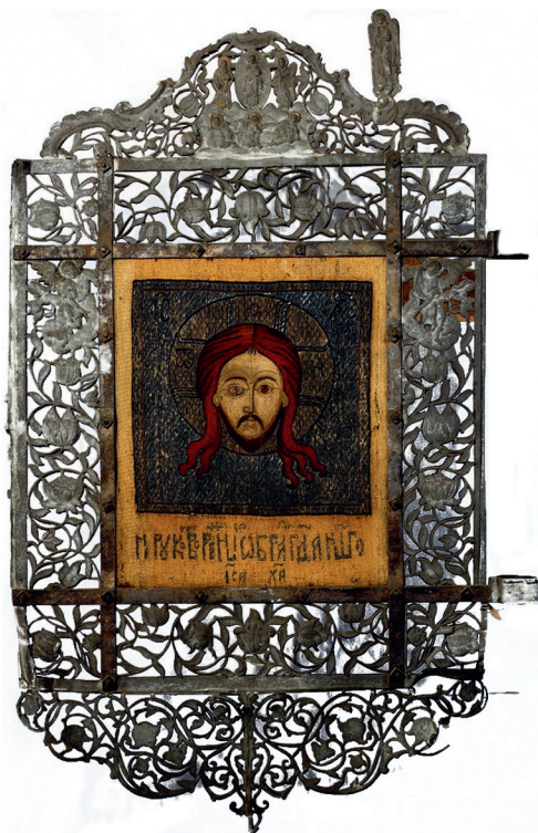
Хоругвь. Спас Нерукотворный, XVII век Сольвычегодский историко-художественный музей

Позже появился другой вариант этого предания. Когда Христа вели на Голгофу, Вероника отерла платом залитое потом и кровью лицо Иисуса, и оно отобразилось на материи. Этот эпизод включен в католический цикл Страстей Господних. Лик Христа в подобном варианте пишется в терновом венце, со следами крови, иногда с закрытыми глазами.