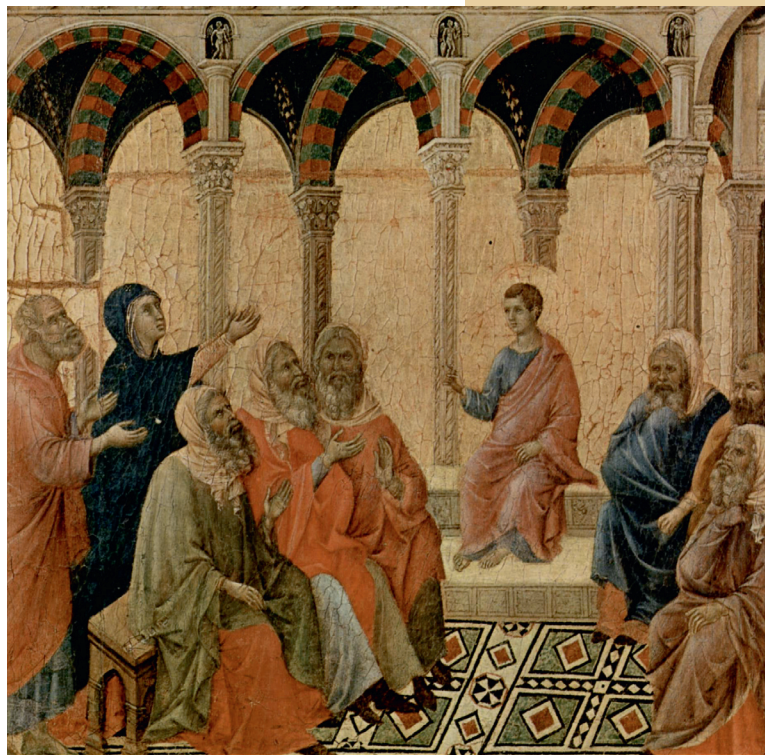
Отрок Иисус среди учителей.

В чем же была главная роль Мессии, так и не ставшего великим земным правителем, но изменившим навсегда всю жизнь человечества?