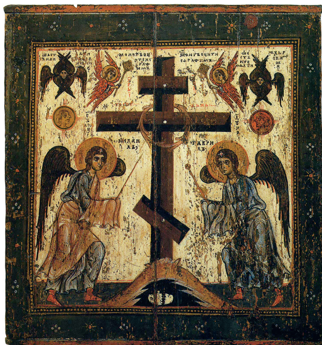
Поклонение кресту. Обратная сторона Спаса Нерукотворного. XII век. Новгородская школа, ГТГ

Святителем Алексием была привезена в Москву из Константинополя икона Спаса Нерукотворного (XIV век), которая с 1360 года находилась в иконостасе соборной церкви Спасо-Андроникова