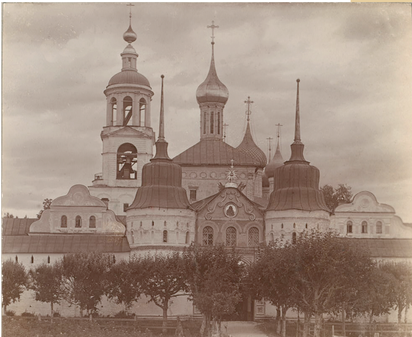
Вход в Толгский монастырь. 1910 г.