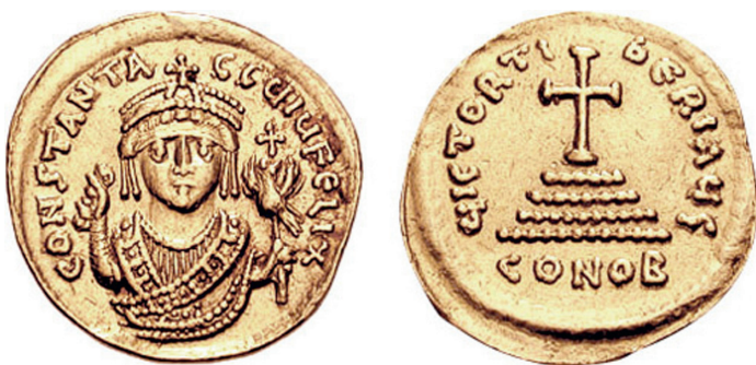
Золотая монета с изображением портрета императора Тиберия

За точность предания ручаться нельзя, ни одна из приведенных выше версий не является утвержденным церковным догматом. История происхождения Спаса Нерукотворного — один из ряда случаев, когда Церковь допускает разномыслие среди верующих. Но, так или иначе, очевидно, что евангельский плат лег в основу обширной иконографии, которая получила широкое распространение во всем христианском мире. ❀