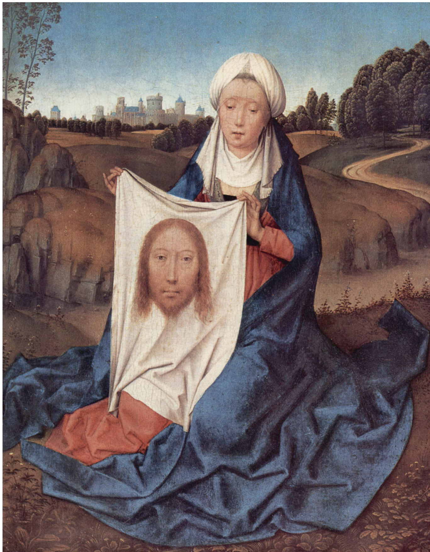
Святая Вероника. Ганс Мемлинг. Ок. 1470 г.