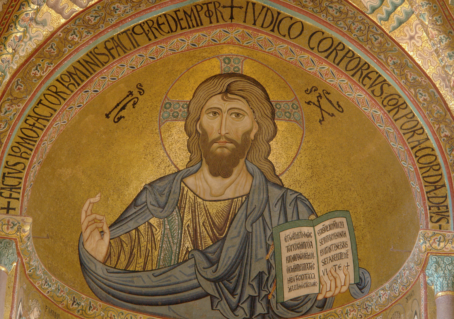
Христос Пантократор, XII век. Византийская мозаика в конхе собора в Чефалу, Сицилия