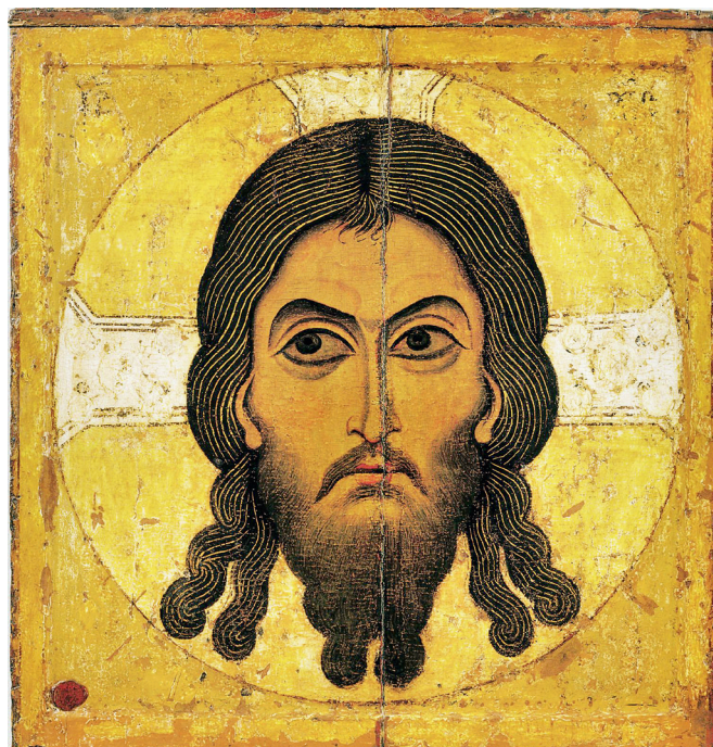
Спас Нерукотворный. XII век. Новгородская школа, ГТГ

Спас Нерукотворный — доминирующий образ Христа в искусстве позднего русского Средневековья. Древнейший из сохранившихся в России списков иконы Спаса Нерукотворного написан новгородским мастером во второй половине XII века.