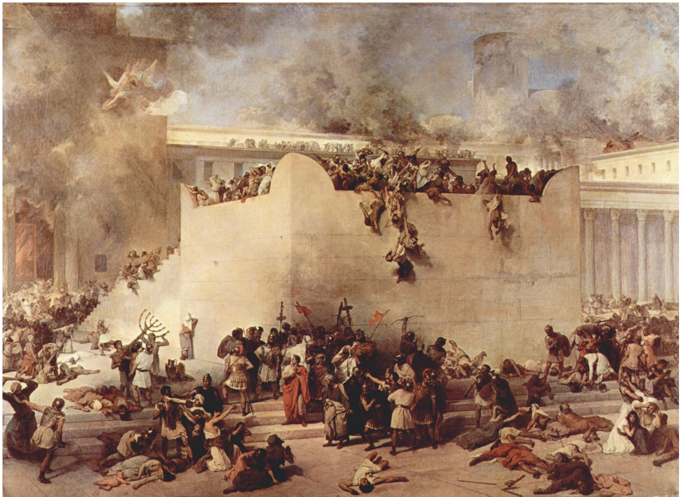
Разрушение Иерусалимского Храма. 1867 г. Франческо Хайес

того времени ветхозаветные заповеди, даже они не знали таких вершин совершенства, к которым призвал своей проповедью Спаситель. Заповедь о любви к ближним была расширена Им до любви ко всему миру, без разделения на своих и чужих. Во Христе равны все люди и все народы. Как пишет об этом апостол Павел, для христианина «нет ни Еллина, ни Иудея, ни обрезания, ни необрезания, варвара, Скифа, раба, свободного, но все и во всем Христос» (Кол. 3:11). Христос не просто призывает к гуманности — Он создает нового человека.