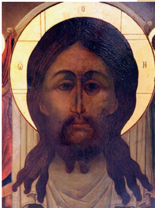
Спас Нерукотворный из Новоспасского монастыря

К этим и другим чтимым в России спискам хочется отнести слова одного из великих русских писателей — Николая Лескова: «Типическое русское изображение Господа: взгляд прям и прост... в лике есть выражение, но нет страстей» . ❀