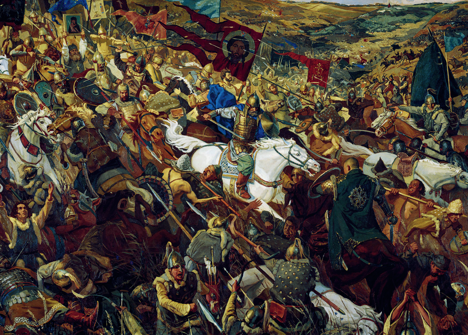
Удар Засадного полка в Куликовской битве.