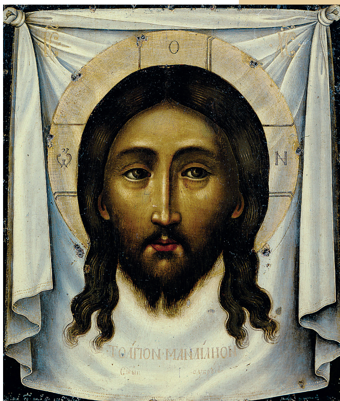
Спас Нерукотворный. 1677 г.