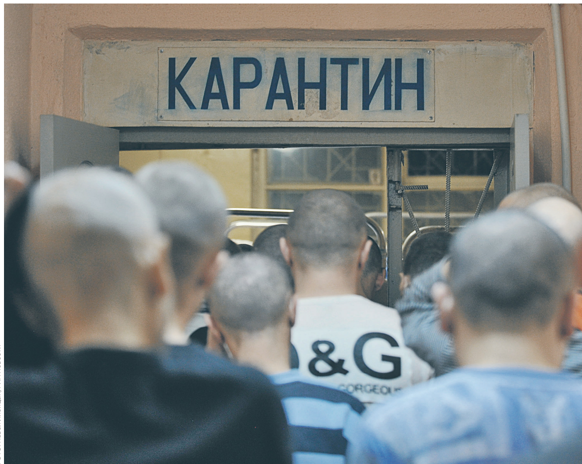
В России около 800 частных реабилитационных центров, из них лишь пятая часть, по мнению специалистов, «работает добросовестно». На фото: пациенты центра «Город без наркотиков»

К работе реабилитационных центров предлагается закрепить 24 требования: 14 — обязательных, десять — факультативных. Если ор-