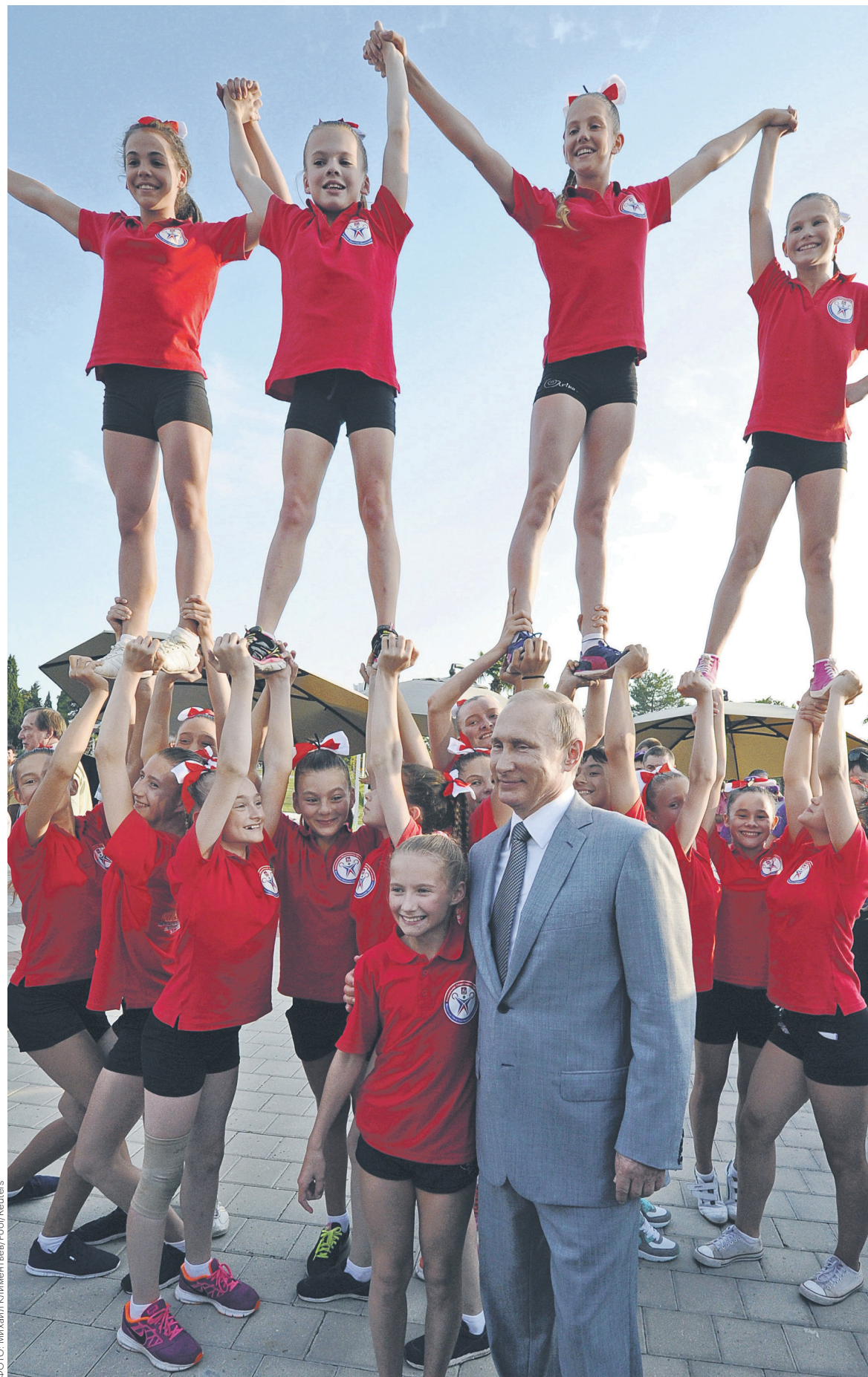
Среди задач четвертого президентского срока Владимира Путина — рост численности населения России и увеличение продолжительности здоровой жизни россиян

ЦСР, которым руководит экс-министр финансов Алексей Кудрин, готовил масштабную экономическую программу для Владимира Путина, идеи из нее президент использовал и в своем послании 1 марта. Самого Кудрина источники РБК и других СМИ называли кандидатом на высокие посты в администрации президента или правительстве. Премьер-министр Дмитрий Медведев, которого Путин уже предложил переизбрать, 7 мая перечислил имена новых потенциальных вице-премьеров