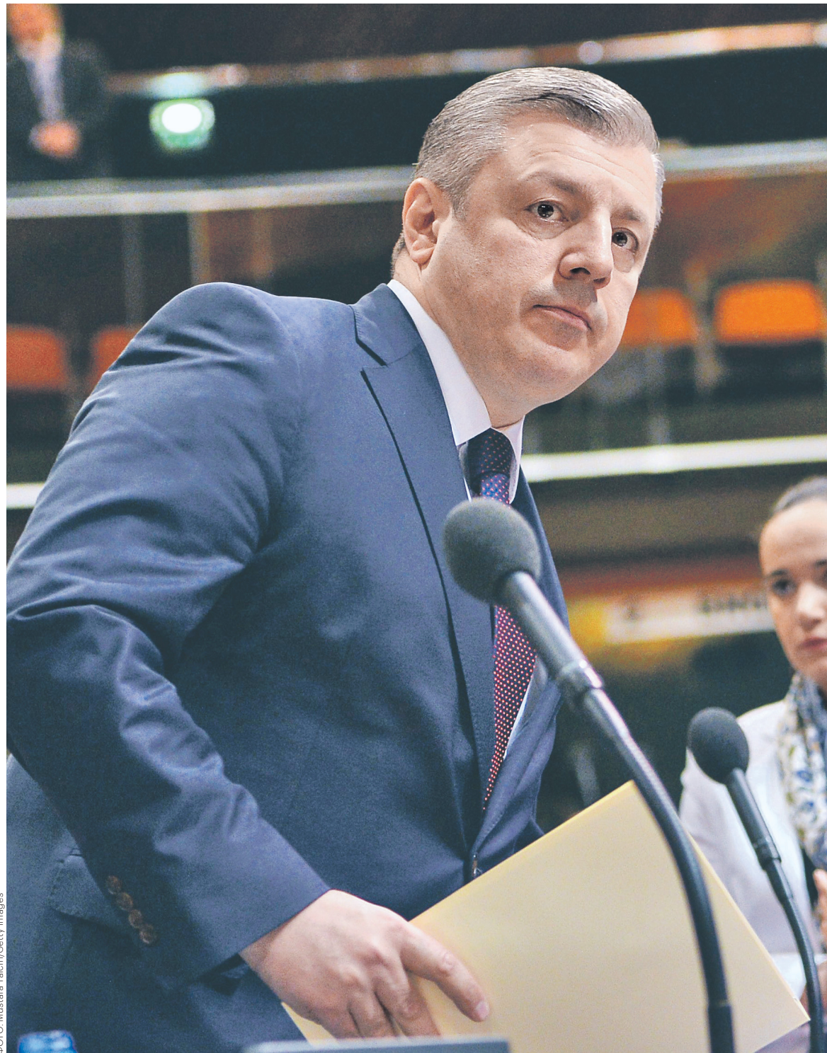
Отставка Георгия Квирикашвили (на фото) — это попытка руководителя «Грузинской мечты» Бидзины Иванишвили восстановить поддержку общественного мнения, считает эксперт

Премьер подал в отставку на фоне продолжающихся с мая акций протеста в Тбилиси, которые активно поддерживает оппозиционное «Единое национальное движение», лидером которого остается экс-президент Михаил Саакашвили. Протесты начались из-за действий полиции в ночных клубах. Полицейские провели рейды по выявлению нар-