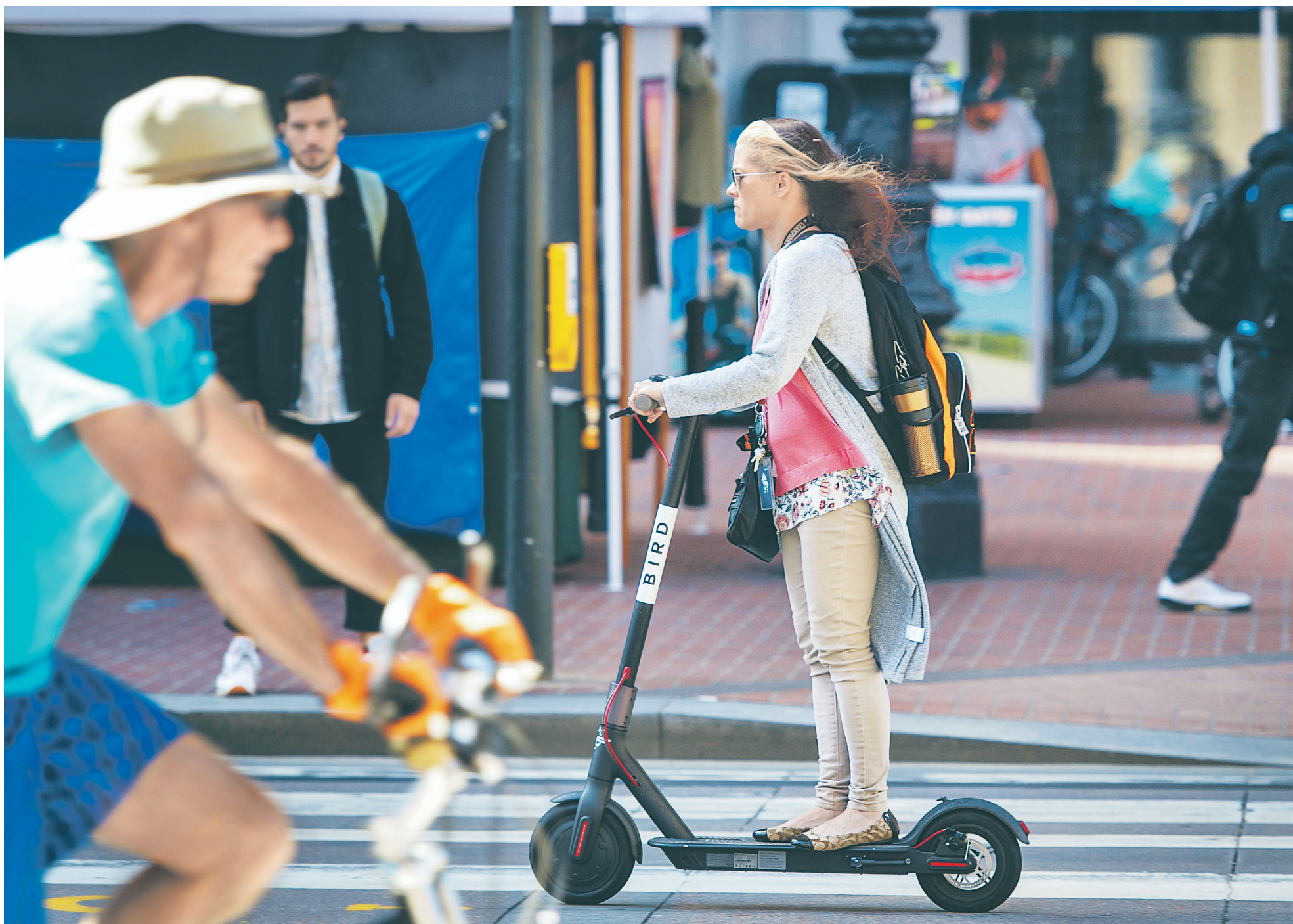
В Сан-Франциско электросамокаты стали настолько популярны, что их количество мэрии пришлось ограничивать: пяти компаниям пока разрешено сдавать в аренду не более 1250 самокатов

Сможет ли новый вид транспорта отвоевать свою нишу в России