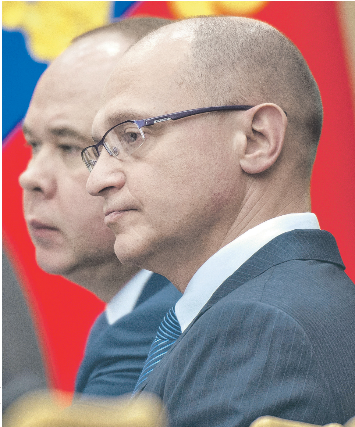
Свой пост сохранили не только глава администрации президента Антон Вайно (на заднем плане), но и оба его первых заместителя — Сергей Кириенко (на переднем плане) и Алексей Громов

Также нежелание президента всерьез менять команду связано и с высоким уровнем неопределенности из-за действий Трампа, которые «видели и только что на