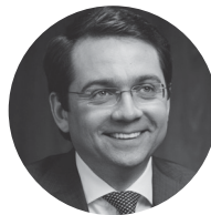
Андрей Чибис Минстрой РФ