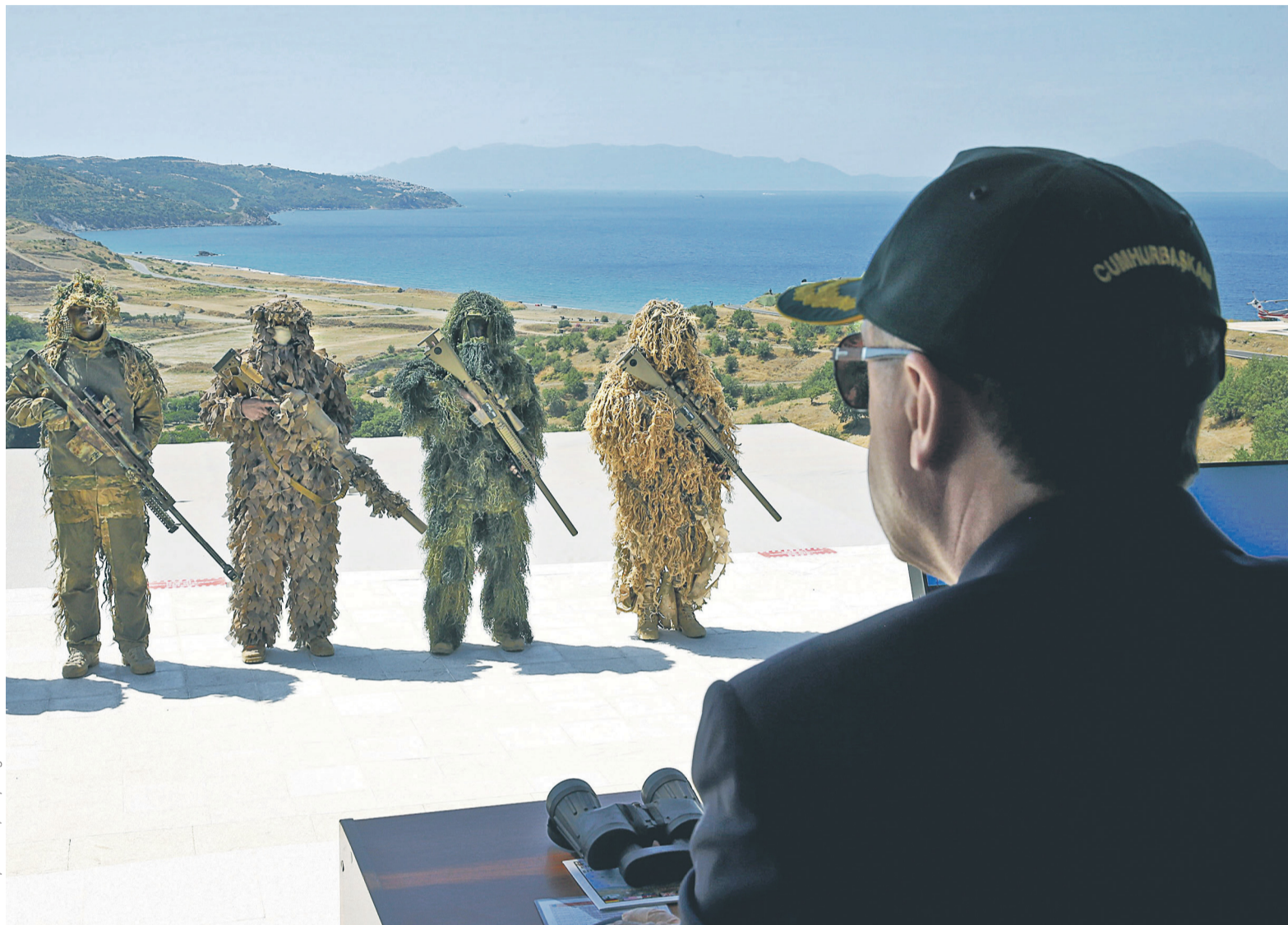
В Анкаре пообещали во всеоружии встретить инициативу США по созданию курдских сил пограничной безопасности. На фото: президент Турции Реджеп Эрдоган на военных учениях

Новость из Вашингтона вызвала негативную реакцию Москвы. «Даже если принять во внимание, что ИГ до конца не уничтожена, те действия, которые мы наблюдаем,