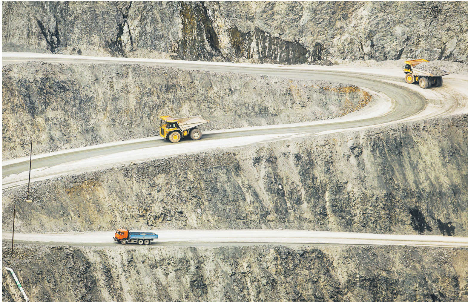
Как говорит эксперт, китайцы отличаются тщательным подходом к due diligence приобретаемых активов. На фото: принадлежащий «Полюсу» рудник «Восточный»