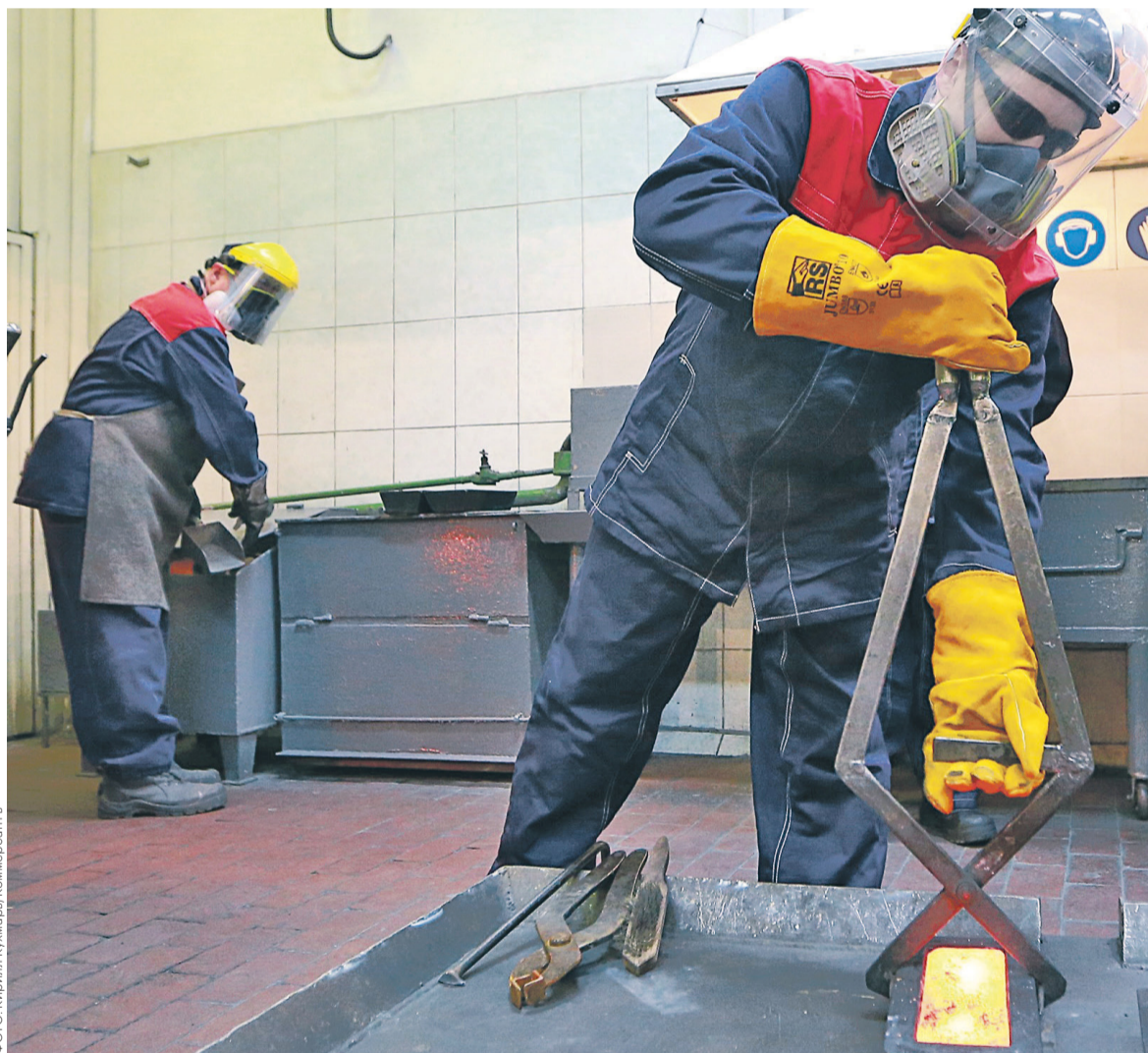
Одно из объяснений срыва сделки «Полюса» с Fosun заключается в том, что китайская компания оказалась в жестких тисках национального финансового регулятора