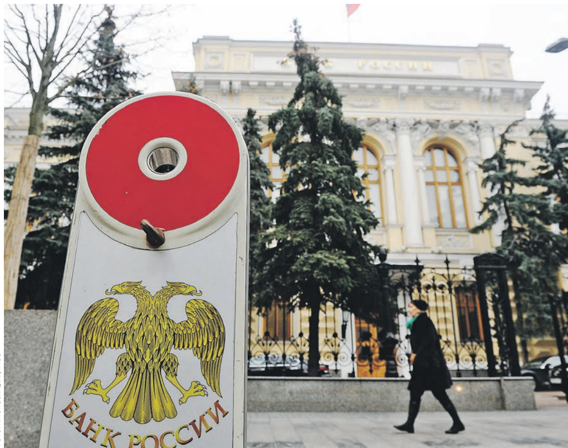
Регулятор неоднократно заявлял, что ему важно не только достижение цели по инфляции (4% на конец 2017 года), но и закрепление ее на этом уровне. Это требует проведения умеренно жесткой монетарной политики в течение длительного времени

Банк России акцентирует внимание на этом показателе, по-