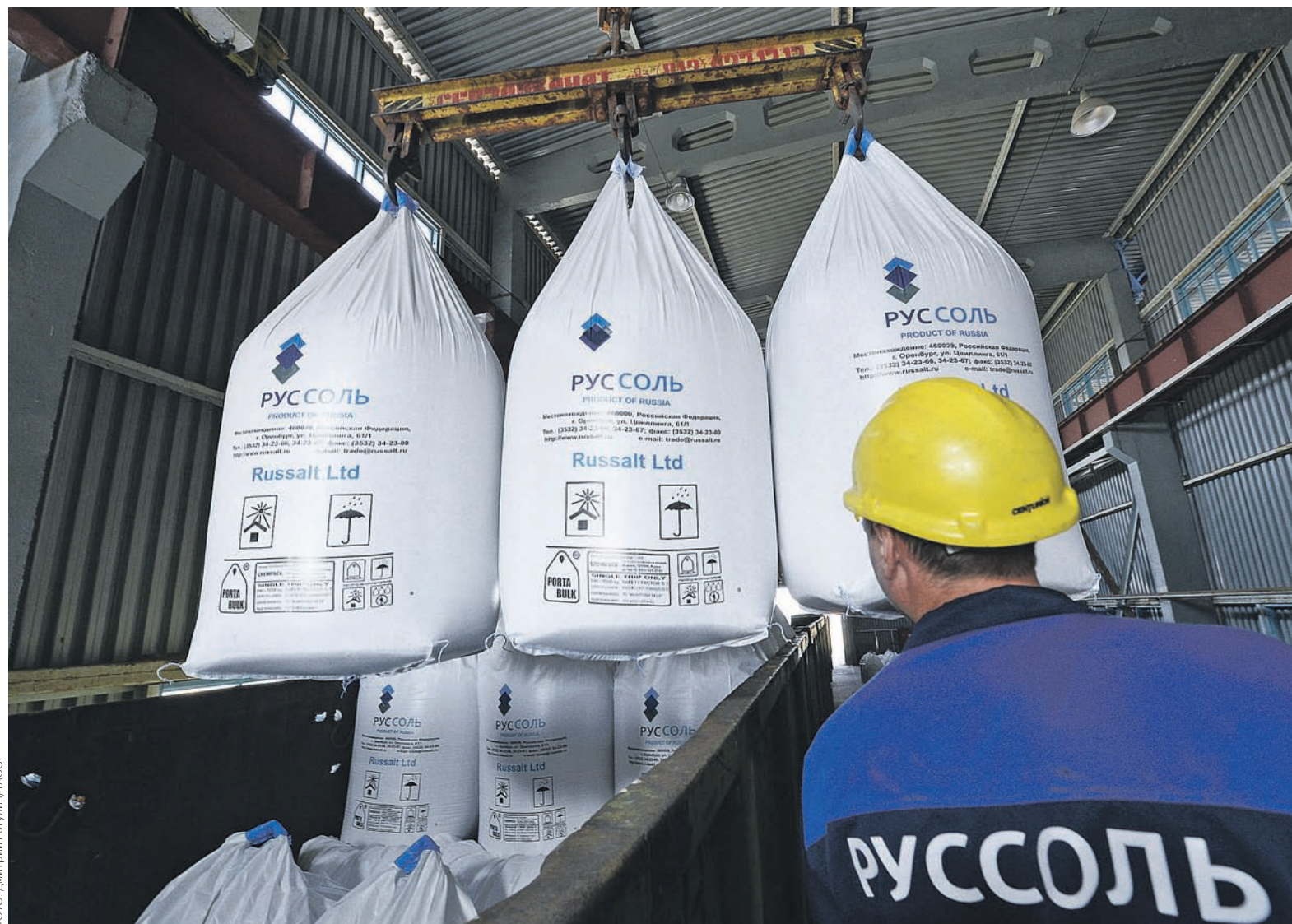
Раскрытие «Руссолю» информации о ее владельцах может быть связано с ведущейся в России политикой деофшоризации