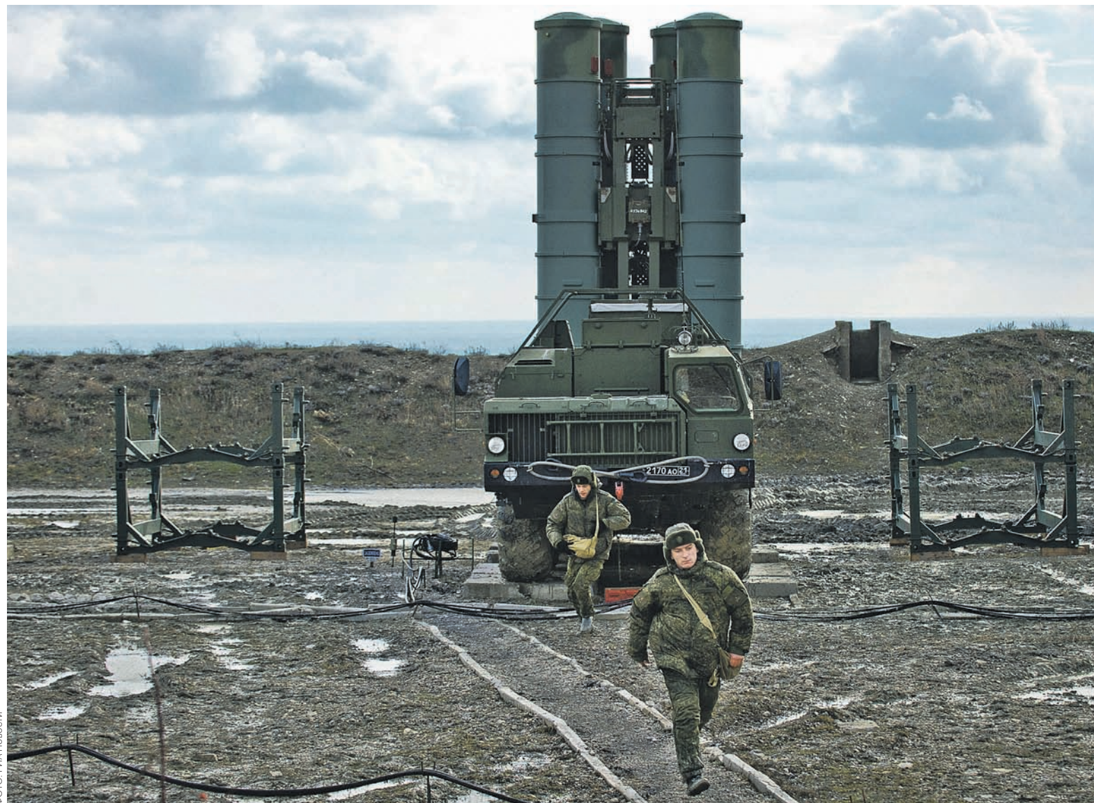
ЗРК С-400 «Триумф» предназначен для уничтожения авиации, крылатых и баллистических ракет, а также может применяться против наземных объектов

Также в случае появления в регионе ударных элементов американской системы противоракетной обороны «Иджис» этот комплекс сможет эффективно им противодействовать, а именно отражать налеты крылатых ракет «Томагавк», добавил эксперт.