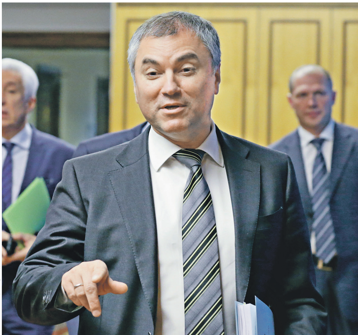
С приходом нового спикера Вячеслава Володина график работы Госдумы изменился. Введение трех недель пленарных заседаний не нравится многим депутатам, но им, скорее всего, придется смириться с новым расписанием

Куда комфортнее работать в регионах по две недели, заявил РБК на условиях анонимности депутат от «Единой России». По его словам, эти неудобства могут стать поводом для обращения в комитет по регламенту, но пока оно не подготовлено. Депутатам теперь не удастся посещать профильные мероприятия,