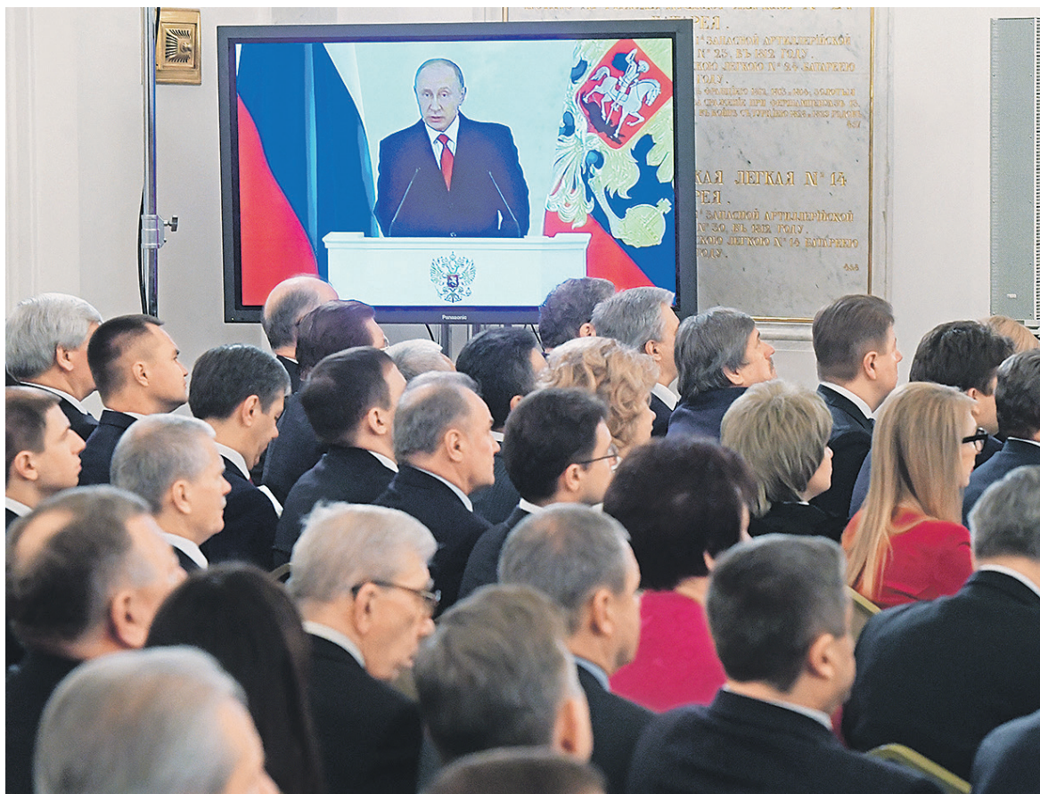
Президент в своей речи поблагодарил граждан, которые «объединились вокруг ценностей не потому, что они довольны», но «потому, что есть понимание и готовность работать ради России»

Президент также поручил правительству завершить формирование правовой базы деятельности НКО (30 ноября Госдума приняла в первом чтении законопроект о господдержке социально ориентированных НКО), «не нагородив дополнительных бюрократических барьеров». «Не прятаться в кабинетах и не бояться разговаривать с людьми» посоветовал чиновникам глава государства.