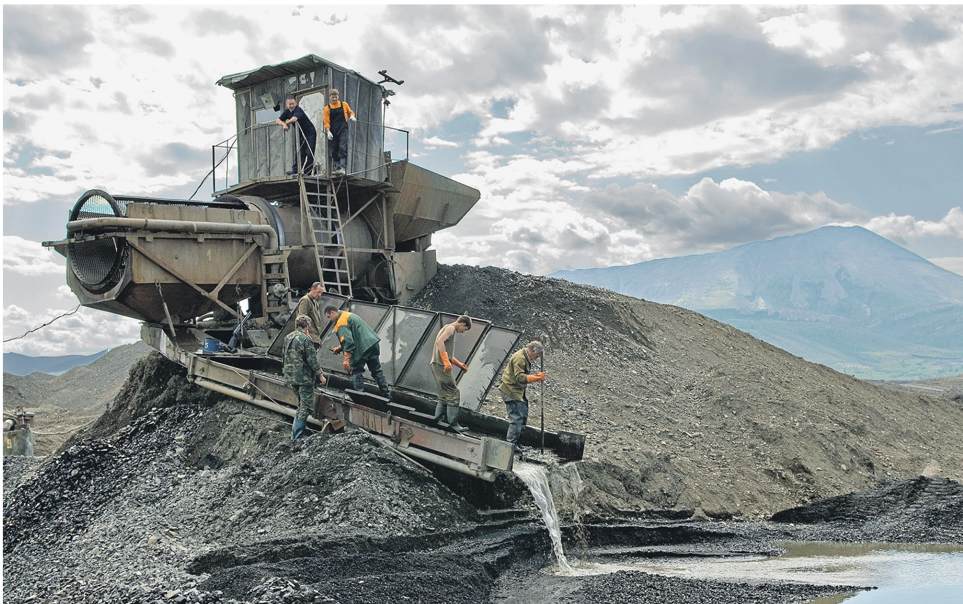
В регионах, где инфляция уже упала ниже ориентира ЦБ, это произошло главным образом из-за падения платежеспособного спроса населения (на фото: старатели производят съемку золотоносной породы в Магаданской области)

В нескольких регионах зафиксирован рост цен ниже установленного ЦБ целевого уровня