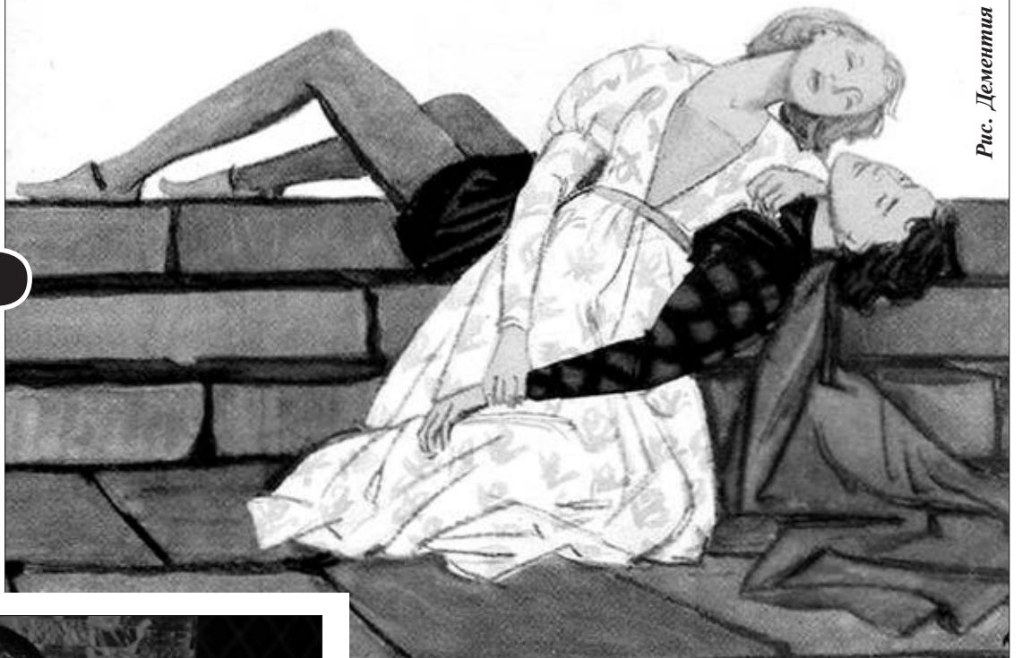
Рис. Дементия Шмаринова

Ромео и Джульетта, пожалуй, самые известные самоубийцы в истории мировой художественной литературы.