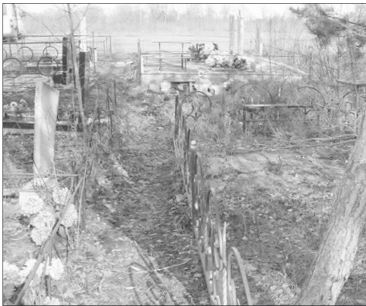
Одна кладбищенская тропа может вести к разным могилам, но не ссорить, а объединять людей в горе.