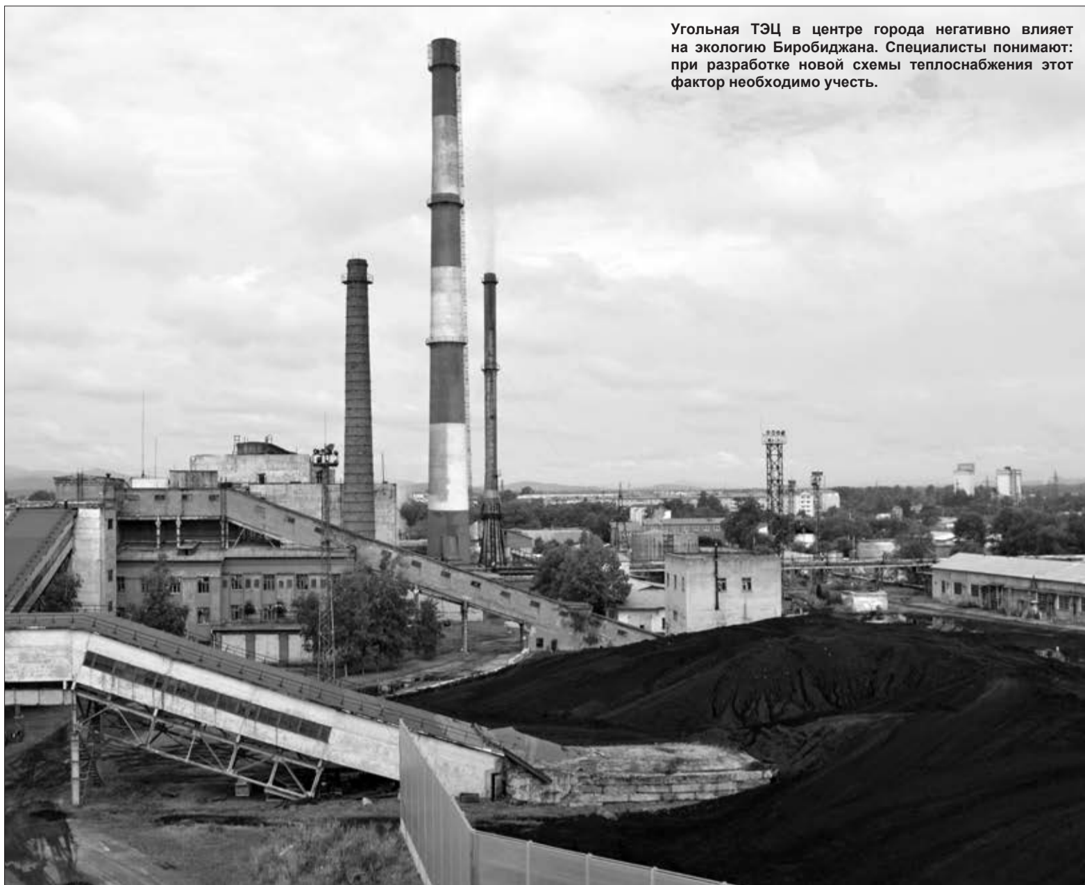
Угольная ТЭЦ в центре города негативно влияет на экологию Биробиджана. Специалисты понимают: при разработке новой схемы теплоснабжения этот фактор необходимо учесть.