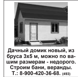
Дачный домик новый, из бруса 3х5 м, можно по вашим размерам - недорого. Строим бани, веранды. Т.: 8-900-420-36-68. (493)

Кошерную мацу ручной работы. Т.: 8-900-419-08-53. (107т).